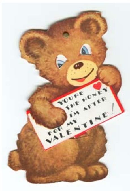
5. Valentinskarte aus den 1930iger (?) Jahren. Made in USA.