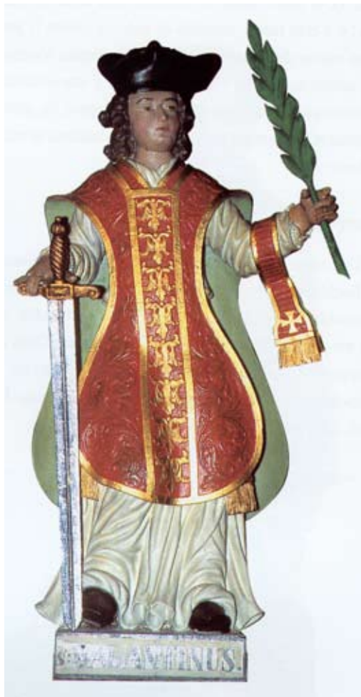
1. St. Valentin. Holzstatue, 18. Jh., Bockholtz (Goesdorf).