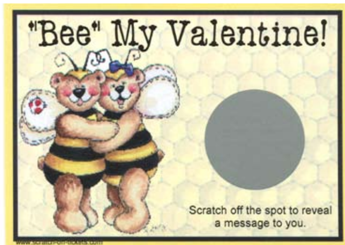
10. Rubbelkarte als moderne Valentinsbotschaft. USA 2007 (Sammlung d. Autors).