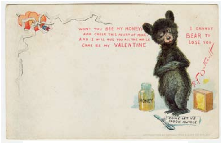
3. Valentinskarte aus dem Jahre 1903. Raphael Tuck & Sons Co Ltd., N.Y. (Sammlung d. Autors).