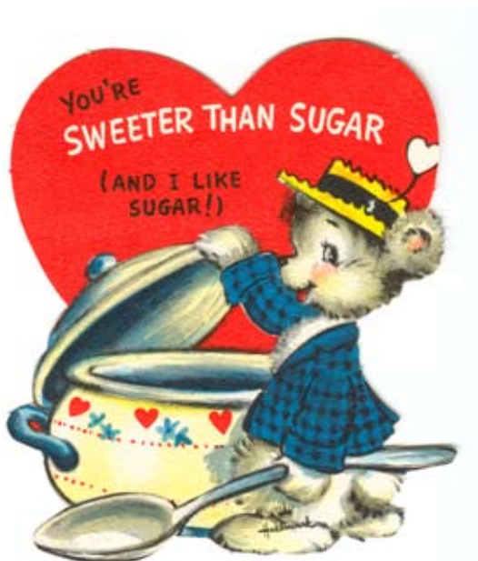
8. Valentinskarte aus den 1950iger Jahren. Hallmark USA.