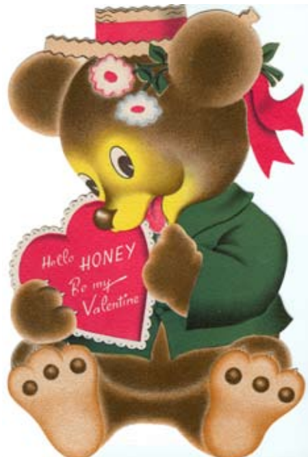
7. Großformatige Valentinskarte aus dem Jahre 1948. Norcross Inc., New York.