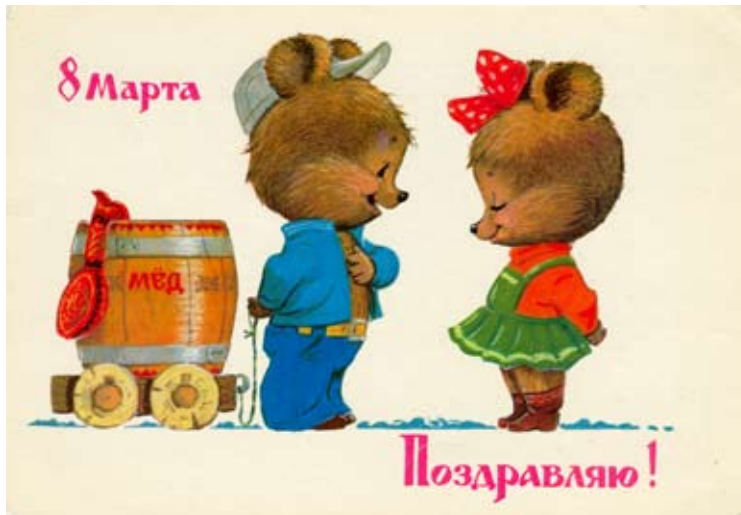
9. Sowjetrussische Glückwunschkarte für den Internationalen Frauentag (8. März), in der UdSSR ein Feiertag, der sich zu einer Art Mischung aus Mutter- und Valentinstag (mit kleinen Geschenken und Blumen für die Frauen) entwickelt hat. Das Faß ist mit Honig (russ. : med) gefüllt. (Karte aus dem Jahre 1982, Sammlung d. Autors).