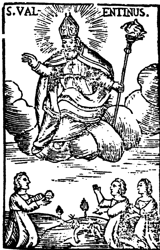
2. St. Valentin als Schutzpatron gegen Fallsucht. Bild auf einem Aufnahmeschein der Valentinus-Bruderschaft (Helenenberg) aus dem Jahre 1767 (aus : Donckel 1967).

Im Kreuzherrenstift auf Helenenberg gab es eine Valentinus-Bruderschaft, die von Clemens XIII., Papst von 1758 bis 1769, mit einem vollkommenen Ablass bedacht worden war. Ein Bild auf einem Aufnahmeschein der Bruderschaft aus dem Jahre 1767 stellt St. Valentin im Bischofsornat auf einer