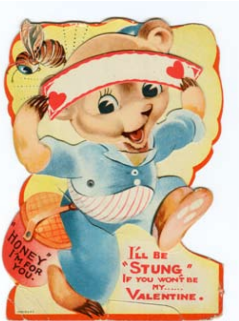
6. Valentinskarte aus dem Jahre 1943 (Sammlung d. Autors).