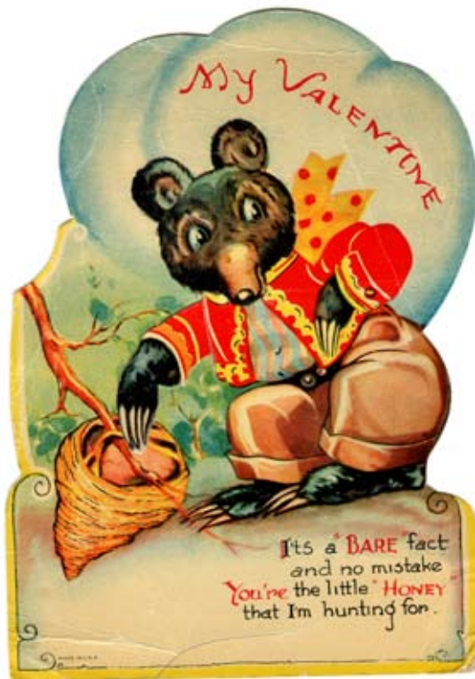
4. Valentinskarte aus dem Jahre 1938. Made in USA.